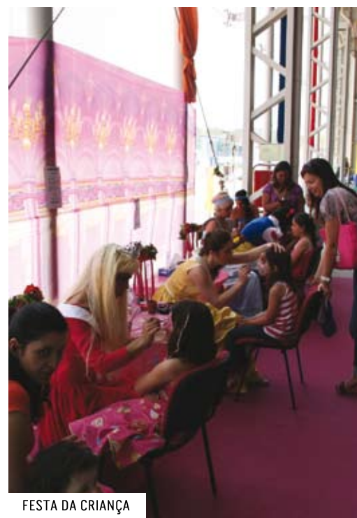
FESTA DA CRIANÇA