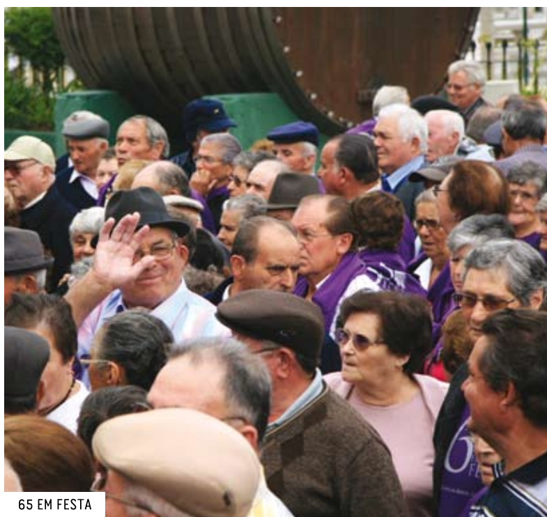
65 EM FESTA