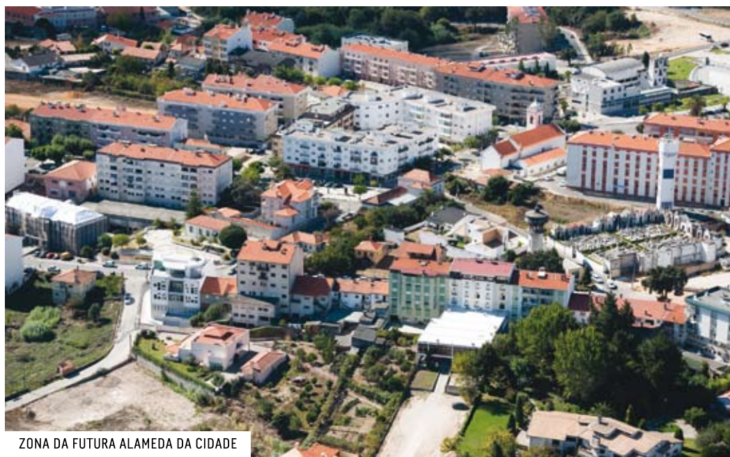
ZONA DA FUTURA ALAMEDA DA CIDADE