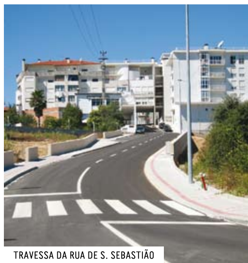
TRAVESSA DA RUA DE S. SEBASTIÃO