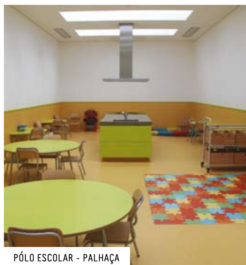
PÓLO ESCOLAR - PALHAÇA