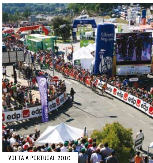
VOLTA A PORTUGAL 2010

Um orçamento adequado à prossecução do desenvolvimento e transformação de Oliveira do Bairro num município de referência de conciliação harmoniosa e inteligente entre crescimento sustentado, ambiente e qualidade de vida, através da implementação de políticas de desenvolvimento local, que promovam a requalificação urbana e constituam um estímulo ao emprego e ao desenvolvimento económico.