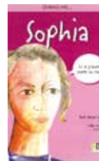
Letria, José Jorge “SOPHIA” Afragide : Oficina do Livro, 2011

Eu sou o João Pastel e estas são as minhas aventuras. É tudo verdade, mas aposto que não vais acreditar em mim. Afinal de contas, alguma vez apanhaste com uma maldição de um pirata fantasmagórico? Ou alguma vez a tua avó foi raptada por um extraterrestre? Ou já foste enganado por um génio? Três incríveis histórias vividas por João Pastel e nas quais ninguém acredita. Mas o João Pastel jura que tudo o que lhe acontece é verdade, e à medida que vai vivendo as suas aventuras desenha o que lhe vai na cabeça e vai fazendo divertidos comentários no seu inseparável bloco de notas.