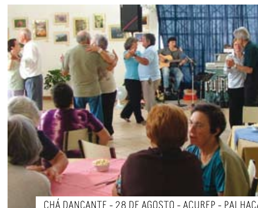
CHÁ DANÇANTE - 28 DE AGOSTO - ACUREP - PALHAÇA

O próximo bailarico de domingo para mais de 65 anos acontece na Mamarrosa, no salão da Associação de Melhoramentos desta freguesia, a partir das 16h00. A iniciativa é dedicada aos seniores com mais de 65 anos e é de entrada gratuita. Esta será a 5ª edição do Chá Dançante - matiné seniores, uma iniciativa da Câmara Municipal de Oliveira do Bairro, através da unidade de Acção Social, que tem vindo a crescer em adesão e que pretende acima de tudo promover o convívio, diminuir as possíveis situações de isolamento social desta faixa etária e contribuir para a melhoria da qualidade de vida das pessoas.