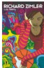
Zimler, Richard “ILHA TERESA” Afragide : D.Quixote, 2011

A vida de Teresa muda radicalmente quando os pais deixam Lisboa para irem viver em Nova Iorque. Não estando preparada para a vida na América, com dificuldade para se exprimir em inglês, Teresa encontra refúgio no seu particular sentido de humor e no único amigo, Angel, um rapaz brasileiro de 16 anos, bonito, mas desastrado, que adora John Lennon e a sua música. Mas o mundo de Teresa desmorona-se completamente quando o pai morre e a deixa, a ela e ao irmão mais novo, com uma mãe negligente e consumista.