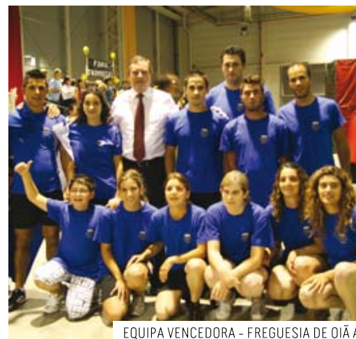
EQUIPA VENCEDORA - FREGUESIA DE OIÃ A

A freguesia de Oiã A foi a grande vencedora desta edição de 2011. O Troviscal conquistou um honroso 2º lugar com a equipa Troviscal B e em 3º lugar, a freguesia vencedora destes jogos nas últimas edições, com a equipa Marmarrosa A.