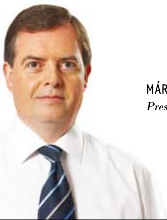
MÁRIO JOÃO OLIVEIRA Presidente

E foi de novo através do desporto, na sua vertente de lazer e de algum bairrismo, que se voltou a encher o Espaço Inovação, em torno de mais uma edição dos jogos "Municípios Sem-Fronteiras". Foram dois serões de grande festa da juventude que assinalaram com bastante alegria e desportivismo o 8º aniversário da cidade de Oliveira do Bairro. A Cidade que este ano conquistou um espaço de qualidade com a conclusão das obras no edifício público. Um espaço que agora, reabilitado, confere a dignidade merecida a todos os cidadãos que ali prestam serviços e que naquele espaço são atendidos. E de novo eis-nos em Setembro, mês de recomeços. A todos deixo os votos de bom regresso, ao trabalho e/ou ao estudo, consoante o caso. De uma forma especial a todos quantos regressam à escola, seja na qualidade de educadores ou educandos, votos de que este ano seja de muitos e bons sucessos. Que ele possa ser vivido com entusiasmo e responsabilidade por parte de todos os intervenientes, onde nos incluímos com reforçado empenho. Enquanto Município, estamos conscientes do nosso papel para o sucesso do sistema de ensino concelhio, promovendo equipamentos de excelência e garantindo o bom cumprimento das restantes competências. Queremos contribuir para que a Escola dê passos significativos no sentido de preparar e educar os nossos cidadãos e munícipes para a vida e para os valores da cidadania. Para que também eles, um dia, possam contribuir para o progresso de Oliveira do Bairro e do País.