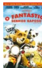
Anderson, Wes, real. “O FANTÁSTICO SENHOR RAPOSO” [S.l.]: Twentieth Century Fox, 2010

“Num país em que a voz dos poetas tem sido tão importante para falar de tudo aquilo que somos, do mar, da distância, da memória e da vida, quem se diz poeta é como se assinasse um pacto com o destino e não pudesse ser outra coisa, ainda que escreva também peças de teatro, textos em prosa, ensaios ou livros de crianças. Trata-se mesmo de uma imensa responsabilidade, e acho que estive consciente dela desde que vi uma maçã ser beijada pela luz fresca do amanhecer, desde que guardei na lembrança o vociferar das ondas nos finais do verão na praia da Granja...”