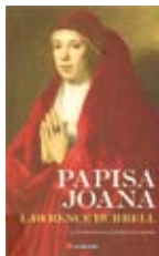
Durrell, Lawrence “PAPISA JOANA” Lisboa : Guerra e Paz, 2011

Um puzzle complicado que deixaria louco qualquer um que não fosse o comissário Adamsberg. À medida que as mortes se sucedem, o comissário e a sua peculiar equipa lutam contra o tempo para encontrar os culpados.