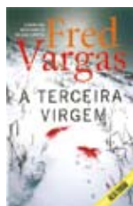
Vargas, Fred “A TERCEIRA VIRGEM” Porto : Porto Editora, 2011

Num registo um pouco diferente do habitual, mas igualmente brilhante, Richard Zimler continua a maravilhar-nos pela forma convincente como nos transporta para o admirável mundo das suas personagens.