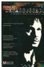
Botelho, João, real. “FILME DO DESASSOSSEGO” Lisboa : Ar de Filmes, 2011

Este thriller aproxima-nos de uma personagem que deverá enfrentar múltiplos demónios, os alheios e os seus próprios, para salvar a única coisa que parece escapar a este contexto atroz: o amor de uma mulher.