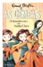
Blyton, Enid “AS GÊMEAS: O TERCEIRO ANO EM SANTA CLARA” Afragide : Oficina do Livro, 2011

Era Uma Vez Um Rei Que Abraçou o Mar dá-te a conhecer D. João II, um rei que sonhou levar mais além os destinos do nosso país e marcou a história dos Descobrimentos Portugueses.