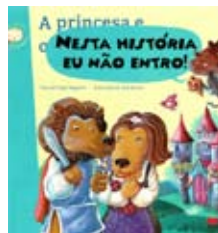
Salgueiro, Tiago “NESTA HISTÓRIA EU NÃO ENTRO!” Alfragide : Gailivro, 2011

Ilustrado de forma sublime por Paulo Galindo, este é um livro para os pais também aprenderem que, às vezes, as crianças têm razão para ralar com eles. Mas sem falar alto... claro!