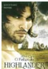
Moning, Karen Marie “O FEITIÇO DO HIGHLANDER” S. Pedro do Estoril : Saída de Emergência, 2011

Século XIV. A cidade de Barcelona encontra-se no auge da prosperidade; cresceu até ao humilde bairro dos pescadores, cujos habitantes decidem construir, com o dinheiro de uns e o esforço de outros, o maior templo mariano conhecido: Santa Maria do Mar. Uma construção paralela à desditosa história de Arnau, um servo da terra que foge dos abusos do seu senhor feudal e que se refugia em Barcelona. Daqui se torna cidadão e, assim, num homem livre. O jovem Arnau trabalha como estivador, palafreireiro, soldado e cambista. Uma vida extenuante, sempre à sombra da Catedral do Mar, que o tirará da condição miserável de fugitivo para lhe dar nobreza e riqueza. Mas com esta posição privilegiada chega também a inveja dos seus pares, que tramam uma sórdida conspiração que põe a sua vida nas mãos da Inquisição... Lealdade e vingança, traição e amor, guerra e peste, num mundo marcado pela intolerância religiosa, a ambição material e a segregação social. Um romance absorvente, mas também uma fascinante e ambiciosa recriação das luzes e sombras do mundo feudal.