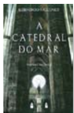
Falcones de Sierra, Ildefonso “A CATEDRAL DO MAR” Lisboa : Bertrand, 2011

Por Este Mundo Acima é uma peregrinação futurista e um relato de memória. Consagração dessa melhor forma de amor a que chamamos amizade, é também uma história sobre a importância redentora dos livros.