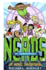
Buckley, Michael “NERDS - OS SUPERESPÕES: UM HERÓI INESPERADO” Portela : Booksmile, 2011

No dia em que a Professora leva a turma a acampar, todos estão muito excitados. E o Boris é o maior, o mais corajoso, o mais prestável campista de todos! Ele está preparado para acudir aos seus pequenos colegas quando se metem em sarilhos. Todos precisam de um amigo como o Boris!