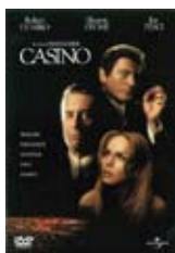
Scorsese, Martin, real. “CASINO” [S.l.]: Universal Studios, 2011