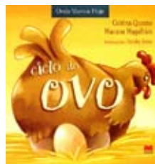
Quental, Cristina “CICLO DO OVO” Alfragide : Gailivro, 2011

Tiago Salgueiro e José Saraiva estavam longe de imaginar semelhante situação... Uma coisa assim tão mágica! Então não é que quando iniciavam o relato da sua história (esta história!) - um escolhendo as palavras a dedo, outro dando-lhes forma e cor -, as suas personagens fugiram livro fora! E agora, perguntaram-se os autores? Como é que vamos arranjar outras? Bem, até um anúncio puseram no próprio livro: “PROCURA-SE personagem simpática...!” Mas sabes, amigo leitor, nem o Leão De Caprio e a Rica Leoa, nem a hipopótamo Clara, nem o Lobo Nesto, nem o cão Rebol Tado, nem o Elias Fante, nem o dinossauro Tiraninho Graxa quiseram entrar neste livro! Só a baleia Bonga ainda tentou, mas... enfim!