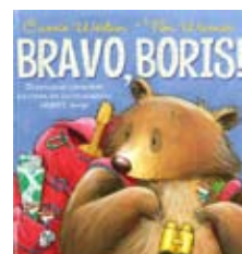
Weston, Carrie “BRAVO, BORIS!” Lisboa : Livros Horizonte, 2011

o Ciclo dos Ovos. E depois de acabada a história, diverte-te ainda com as lengalengas, a canção e a peça de teatro que vêm no final do livro.