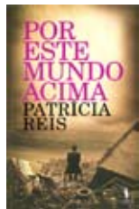
Reis, Patrícia “POR ESTE MUNDO ACIMA” Alfragide : D. Quixote, 2011

Um cenário de terrível desastre assola Lisboa. Poderia ser em qualquer outro lugar do mundo. Os escombros passam a ser paisagem, a cidade e as relações humanas transformam-se vertiginosamente. Entre os sobreviventes há um homem, um velho editor. Procurando amigos e amores desaparecidos encontra um manuscrito e um rapaz e, neles, a porta para uma outra dimensão da vida.