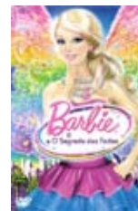
Lau, William, real. “BARBIE E O SEGREDO DAS FADAS” [S.l.]: Universal Studios, 2011

Jackson Jones, um dos rapazes mais populares da escola, perde o seu lugar de destaque quando começa a usar aparelho. É nesta altura que descobre que na cave da escola funciona a base de operações dos Nerds, dirigida pelos alunos menos populares do 5.º ano.