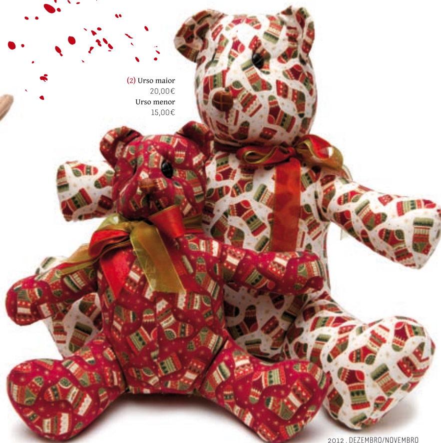
(2) Urso maior 20,00€ Urso menor 15,00€