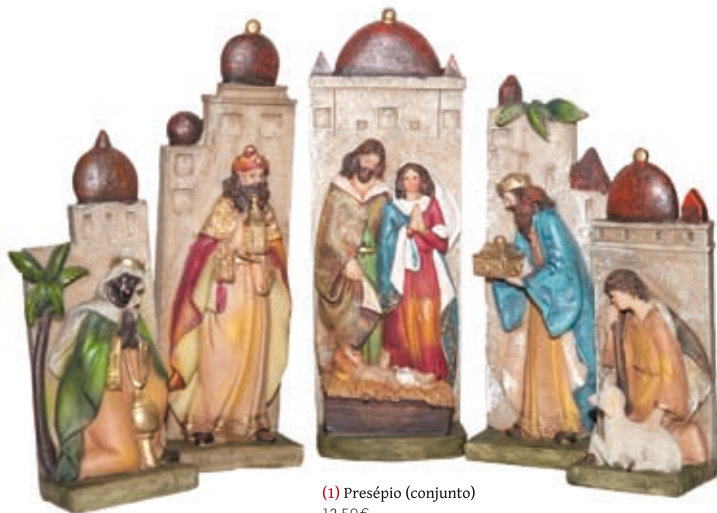
(1) Presépio (conjunto) 13,50€