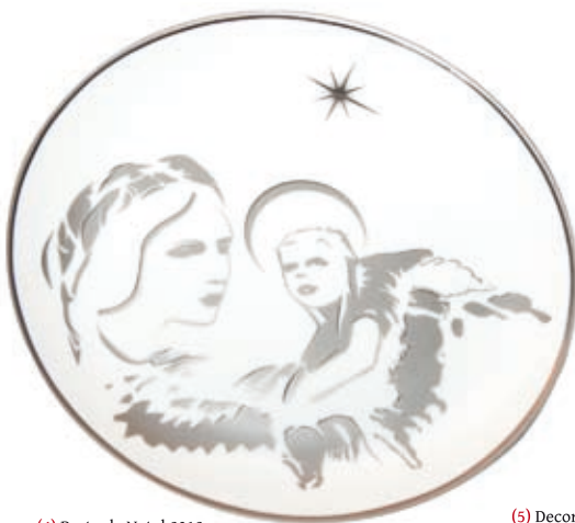
(4) Prato de Natal 2012 10,00€