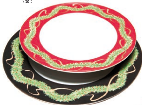
(4) Prato Raso Noel 30,31€ Marcador Noel 40,00€