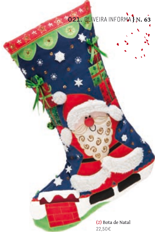
(2) Bota de Natal 22,50€