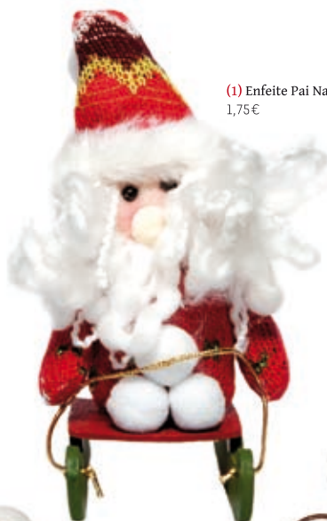
(1) Enfeite Pai Natal 1,75€