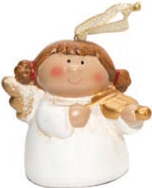
(3) Anjos 1,00€/cada