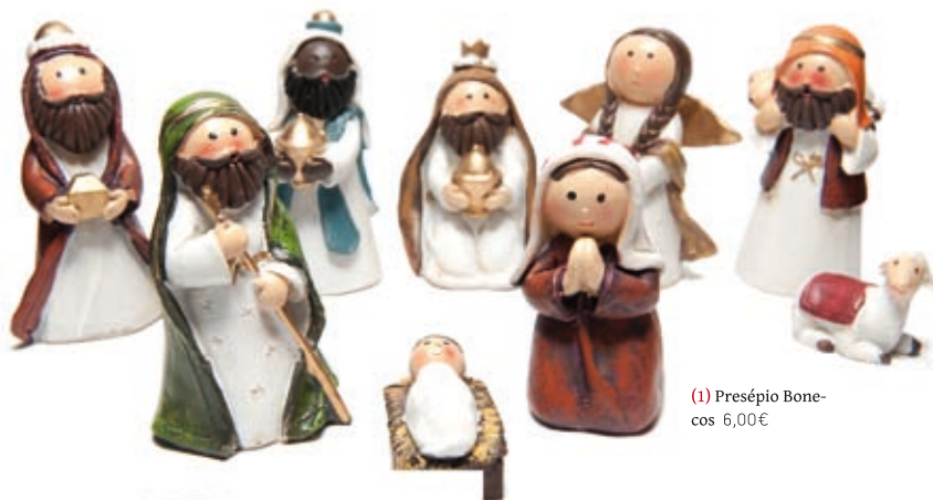
(1) Presépio Bonecos 6,00€