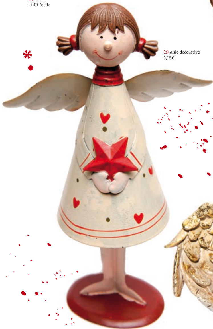
(3) Anjo decorativo 9,15€