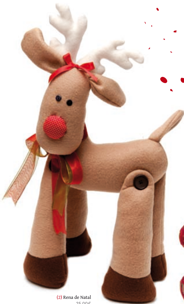
(2) Rena de Natal 25,00€