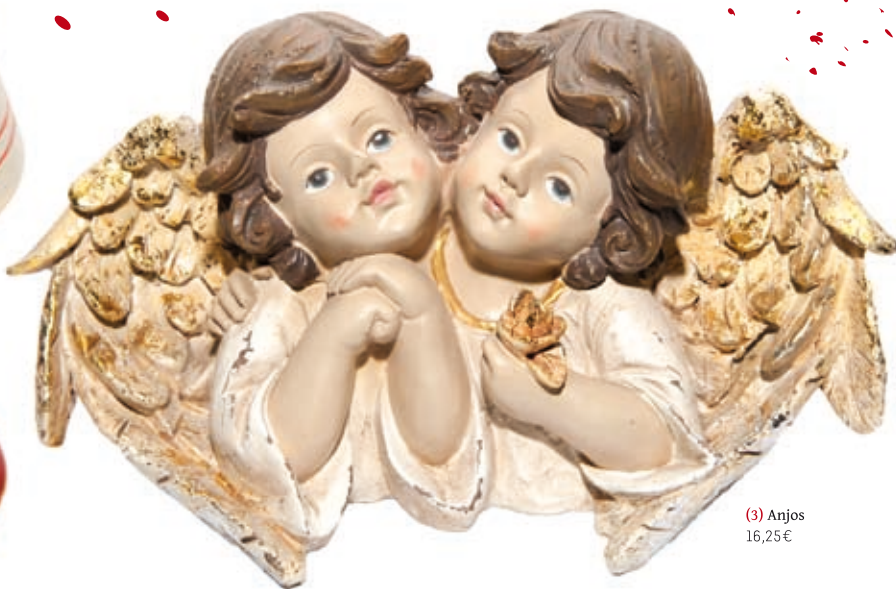
(3) Anjos 16,25€