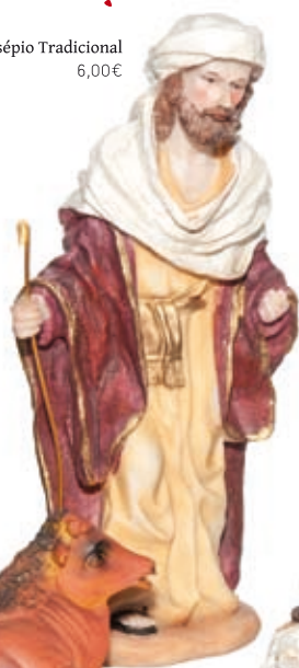
(1) Presépio Tradicional 6,00€