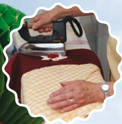
Últimos preparativos SOLSIL - Silveiro

Marque na sua agenda e venha assistir às marchas populares do seu concelho.