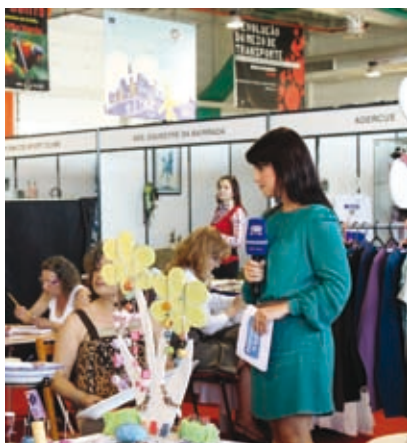
VIVA as Associações em destaque na RTP1, programa Portugal em Direto, 18 de maio

Em maio viveu-se o VIVA. Quatro dias de partilha, formação, sensibilização e festa. Dias vividos num Espaço Inovação onde se multiplicaram encontros. De pessoas, de ofertas, de livros, de atividades, de afetos e de artes. O associativismo no centro das atenções, nas várias vertentes que o mesmo trabalha, do desporto ao folclore, da poesia à dança. Um VIVA que este ano extrapolou o espaço e foi até à cidade, fazer rolar carrinhos e pedalar bicicletas, revivendo velhos tempos e sensibilizando para as questões ambientais e de saúde que hoje tanto nos preocupam.