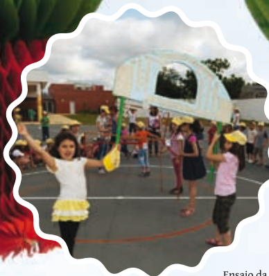
Ensaio da marcha infantil Centro Ambiente Para Todos - Troviscal