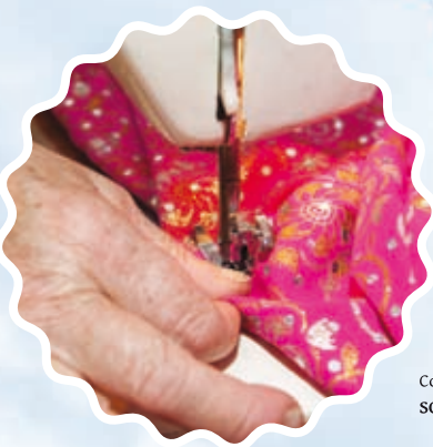
Confeção das roupas SOLSIL - Silveiro