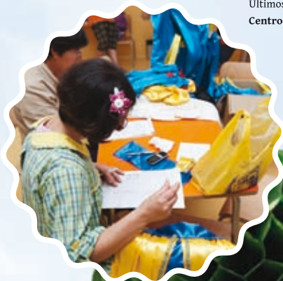
Últimos preparativos - marcha infantil Centro Ambiente Para Todos - Troviscal