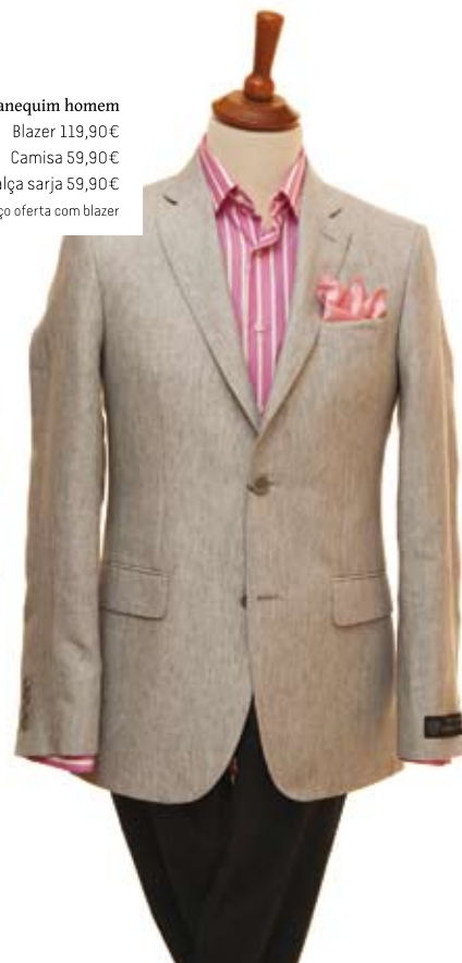
Manequim homem Blazer 119,90€ Camisa 59,90€ Calça sarja 59,90€ lenço oferta com blazer

SASTRE - Vestuário de homem, senhora e criança. Serviço de arranjos e fatos por medida | Morada: Rua Dr. José de Carvalho, n.º 46, Palhaça Contactos: 234 759 178 / sastre@sapo.pt | Horário: seg. a sáb. 9h30-12h30 / 14h30-19h30 | GPS: 40°31'15.57"N / 8°35'59.91"W