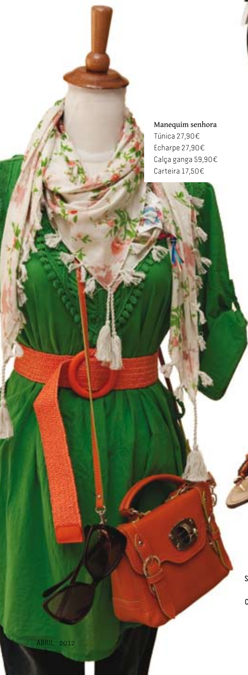
Manequim senhora Túnica 27,90€ Echarpe 27,90€ Calça ganga 59,90€ Carteira 17,50€

As "Pasteleiras" são um tipo de bicicleta clássica cujo nome vem de "pastelar", caminhar lentamente, vagar. Os armazéns Siera, de António de Sousa Vela, nasceram em 1946.