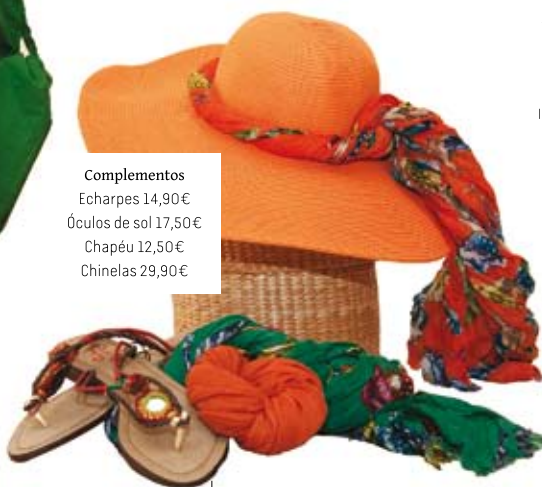
Complementos Echarpes 14,90€ Óculos de sol 17,50€ Chapéu 12,50€ Chinelas 29,90€