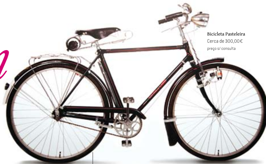
Bicicleta Pasteleira Cerca de 300,00€ preço s/ consulta