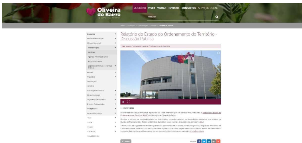
Figura 4 - Divulgação na página institucional do sítio da internet do Município de Oliveira do Bairro