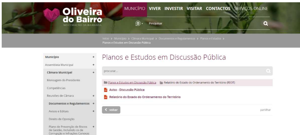
Figura 5 - Informação documental do REOT disponibilizada na página institucional do sítio da internet do Município

A divulgação da Discussão Pública do REOT na página institucional do sítio da internet do Município de Oliveira do Bairro teve início em 14 de setembro de 2022. A divulgação incluía a informação relativa à duração do período de consulta, a ligação para os conteúdos documentais do REOT disponibilizados e as formas de participação admitidas até ao termo do referido período.