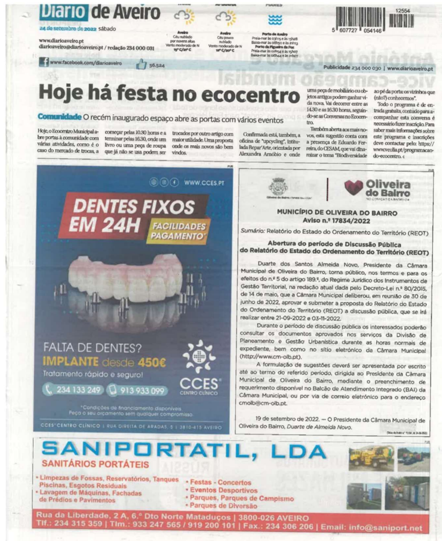
Figura 2 - Publicação do Aviso no “Diário de Aveiro”

O período de discussão pública do REOT de Oliveira do Bairro foi igualmente divulgado em dois jornais regionais, com periodicidade diária.