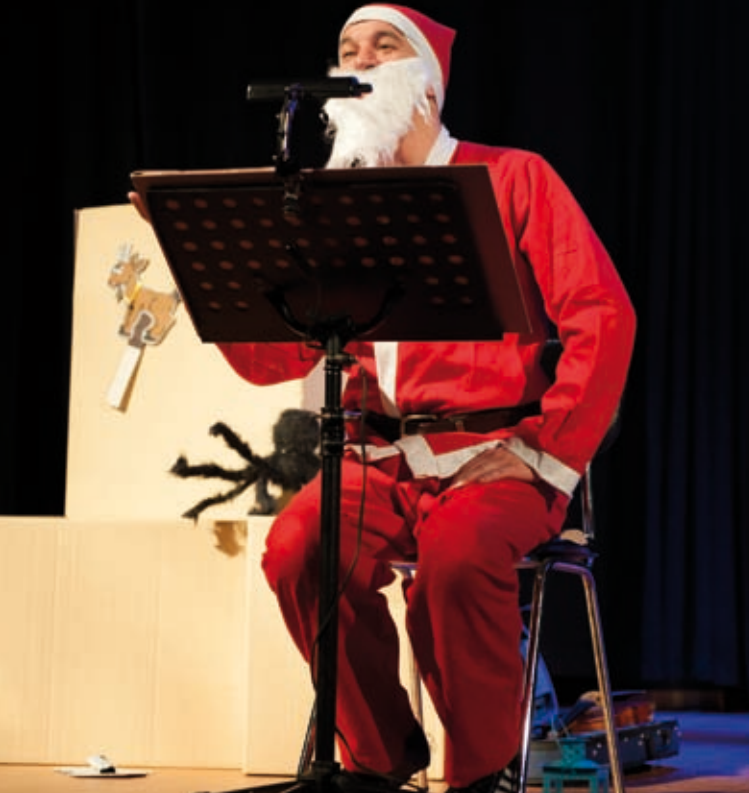
ESPETÁCULO DE TEATRO - TEATRO "ERA UMA VEZ... VÁRIAS VEZES - ESPECIAL NATAL" » 12 e 13 de dezembro » Auditório de Oiã