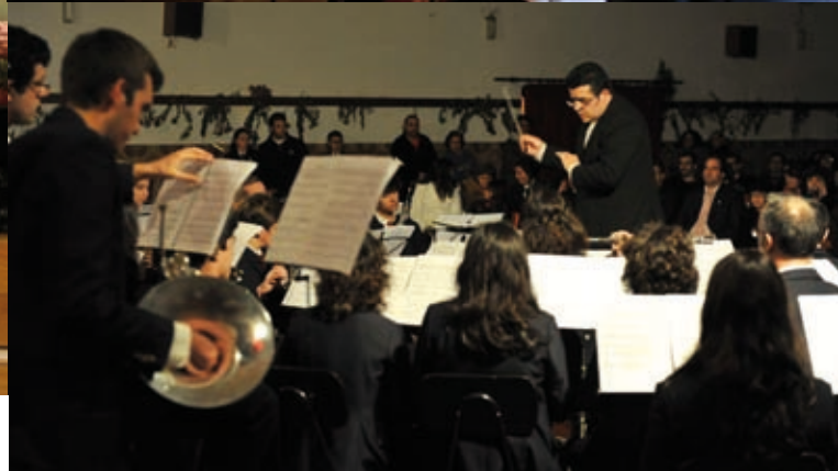
CONCERTO DE ANO NOVO » 4 de janeiro » Salão da União Filarmónica do Troviscal