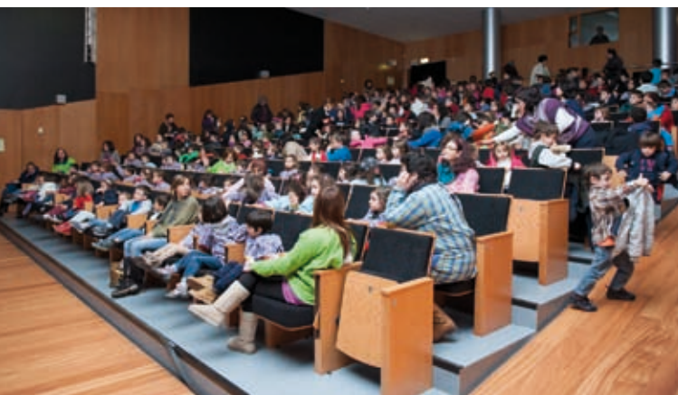
NATAL A LER, FÉRIAS A VALER » 17 a 20 e 26 e 27 de dezembro » Biblioteca Municipal de Oliv. do Bairro e Polo de Leitura de Oiã