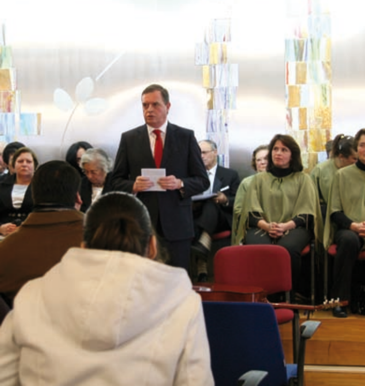
CONCERTO DE NATAL» 22 de dezembro » Salão Nobre dos Paços do Concelho