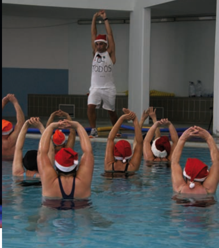
HIDRO NATAL » 16 a 21 de dezembro » Piscinas Municipais de Oliveira do Bairro