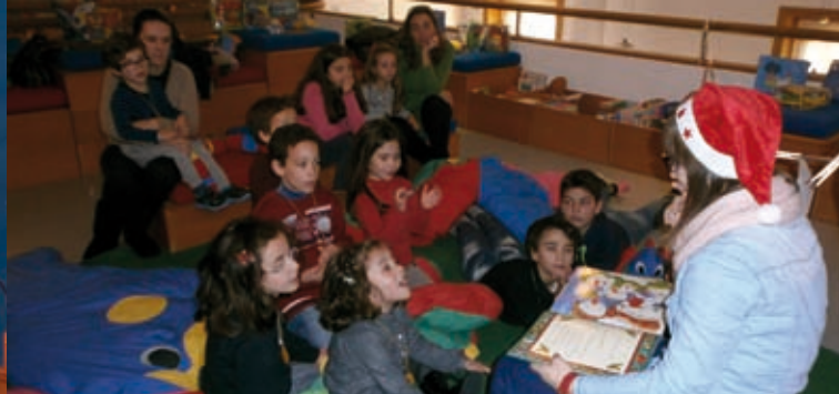
CONTAR-te » 7, 14, 21 e 28 de dezembro » Biblioteca Municipal de Oliv. do Bairro e Polos de Leitura de Mamarrosa e Troviscal