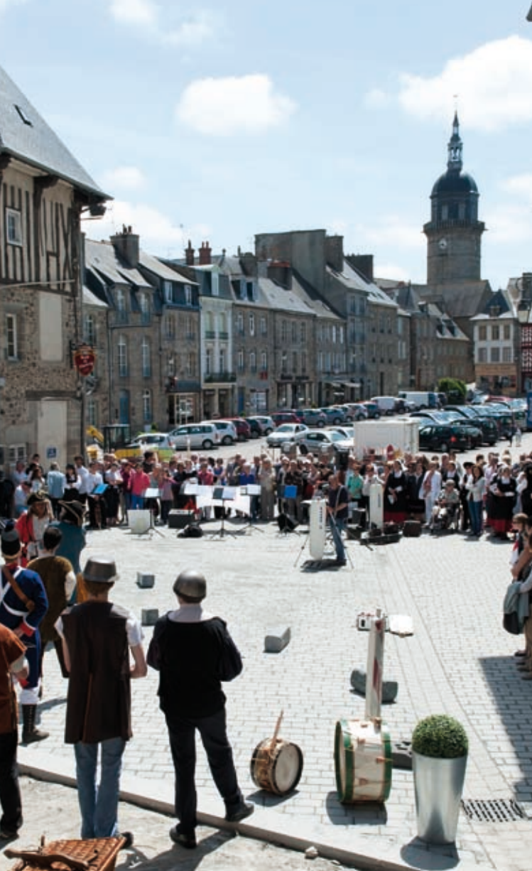
CELEBRAÇÃO DO 15º ANIVERSÁRIO DA GEMINAÇÃO OLIVEIRA DO BAIRRO - LAMBALLE » 28 a 30 de junho