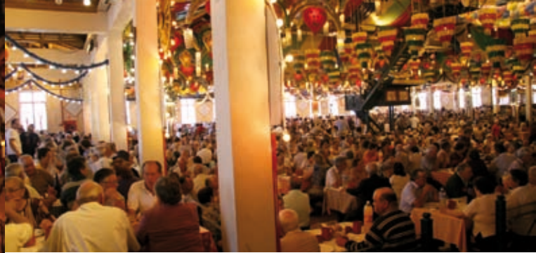
65 EM FESTA » 20 de setembro