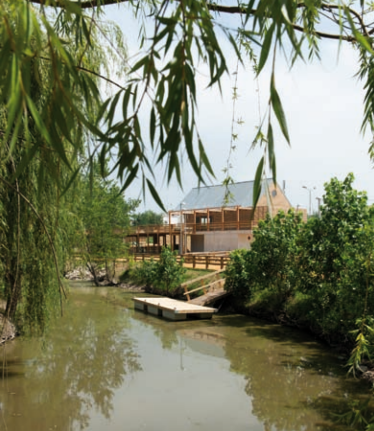
INAUGURAÇÃO DO NOVO PARQUE RIBEIRINHO DO CARREIRO VELHO (REQUALIFICAÇÃO) » 11 de julho