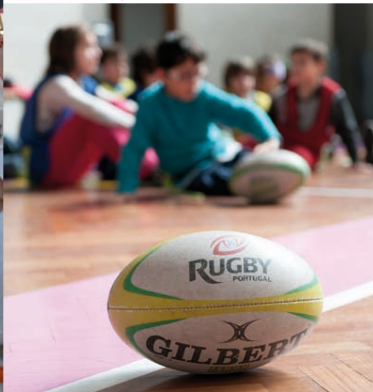
CAMPOS DE FÉRIAS DA PÁScoa E VERÃO » 18 a 28 de março e 1 a 26 de julho