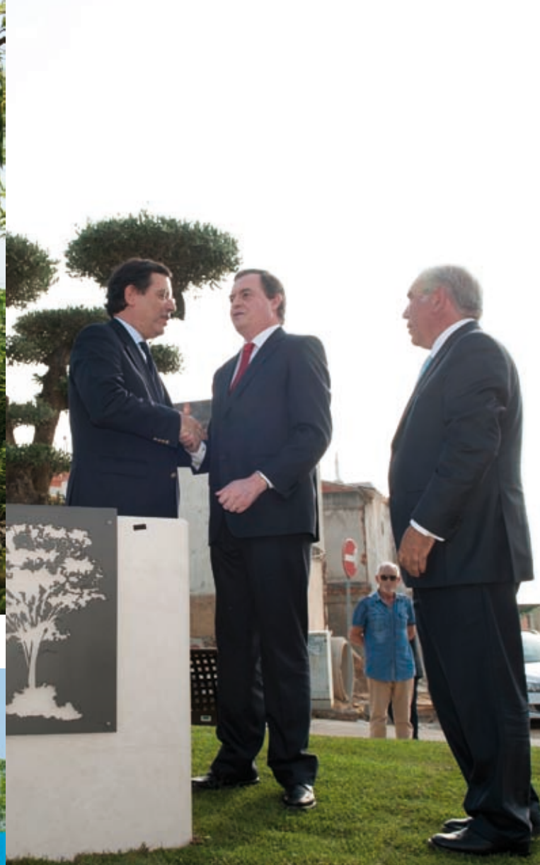
INAUGURAÇÃO DA ALAMEDA DA CIDADE DE OLIVEIRA DO BAIRRO » 12 de julho