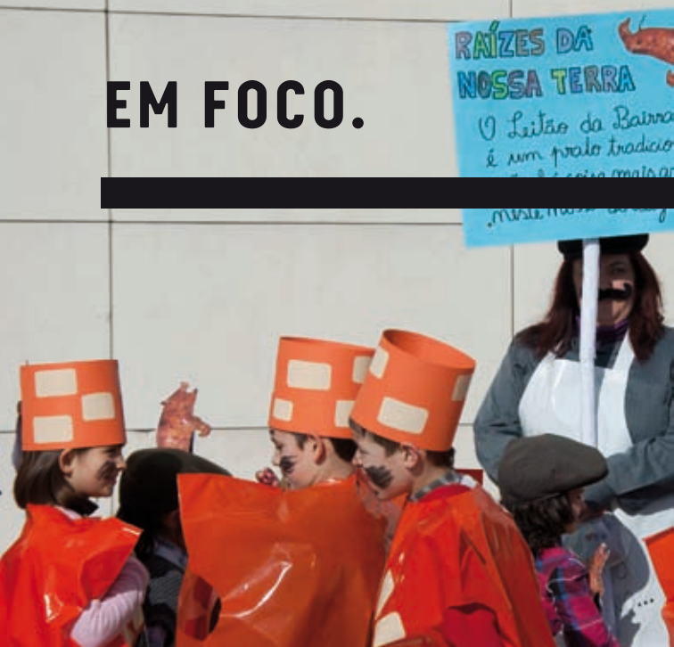
CARNAVAL DA PEQUENADA - "RAÍZES DA NOSSA TERRA" » 8 de fevereiro