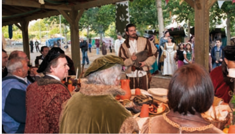
FEIRA MEDIEVAL NO TROVISCAL » 7 a 9 de junho