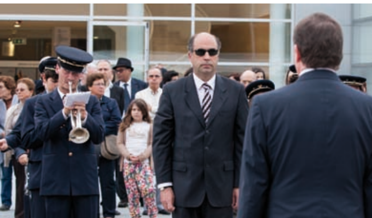
VIVA AS ASSOCIAÇÕES E FESTA DA CRIANÇA » 8 a 12 de maio