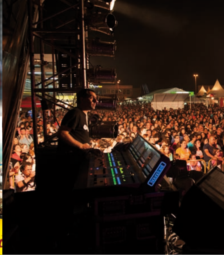
FESTAS DA CIDADE 2013 » AGOSTO