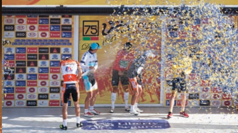
CHEGADA DA 5ª ETAPA DA VOLTA A PORTUGAL EM BICICLETA E ETAPA DA VOLTA 2013 » 12 e 13 de agosto