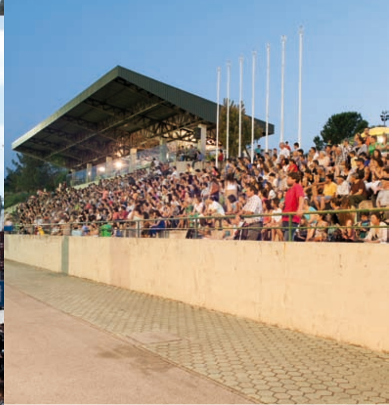
MARCHAS POPULARES » 6 de julho