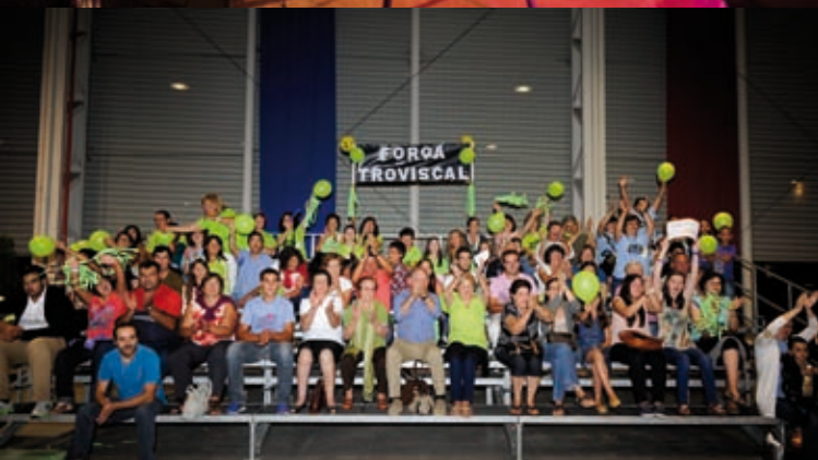
INAUGURAÇÃO DOS POLOS ESCOLARES DE BUSTOS, TROVISCAL, OIÁ NASCENTE E OIÁ POENTE » 25 de setembro