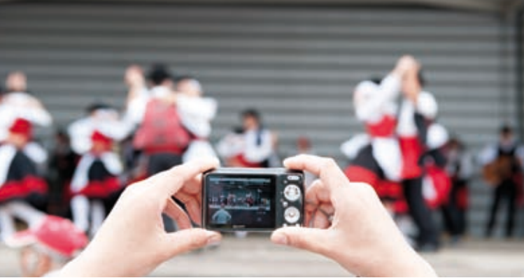
27ª EDIÇÃO DA FIACOBA, 6ª FEIRA DO CAVALO DA BAIRRADA E IV FESTIVAL DO KIWI » 12 a 21 de julho