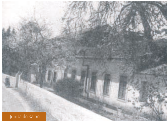
Quinta do Salão

Nota: Henrique Pinto Basto foi o nome escolhido pelos alunos do Polo Escolar de Oiã Poente para patrono deste estabelecimento de ensino, no âmbito da edição de 2013 da iniciativa “Vereadores de Palmo e Meio”.