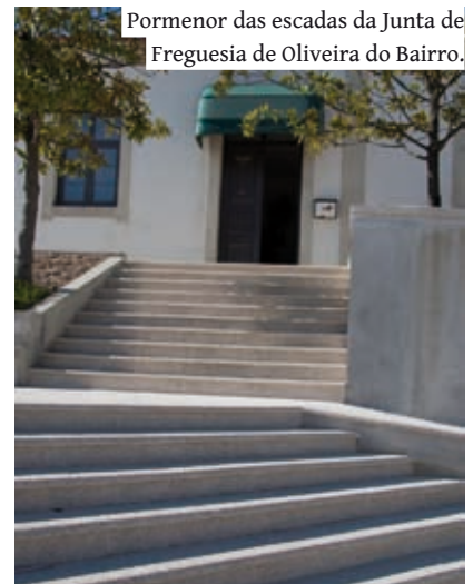
Pormenor das escadas da Junta de Freguesia de Oliveira do Bairro.