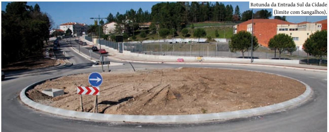
Rotunda da Entrada Sul da Cidade (limite com Sangalhos).