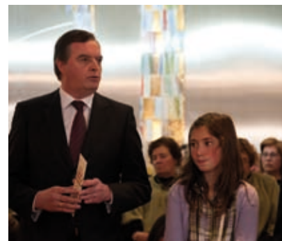
ILUMINAÇÃO DE NATAL.