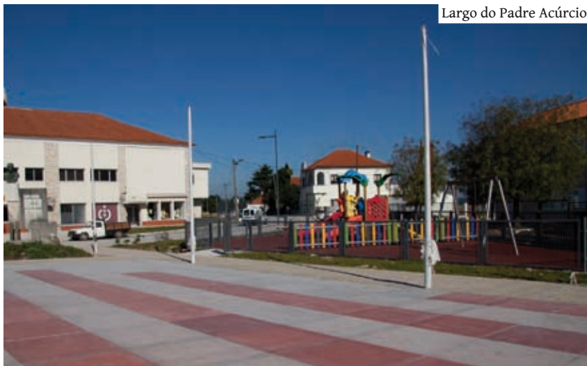
Largo do Padre Acúrcio.

Encontram-se concluídas as fases de obra estruturantes relativas às rotundas III e IV. Ao nível das infraestruturas enterradas apenas se encontra por executar o troço entre a rotunda I e a Casa Verde, cujos trabalhos serão iniciados durante o mês de fevereiro. Continua a fase de pavimentação de arruamentos e passeios, de acordo com as frentes de trabalho.