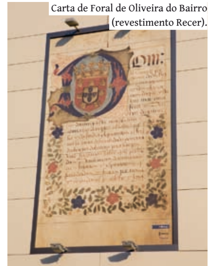
Carta de Foral de Oliveira do Bairro (revestimento Recer).